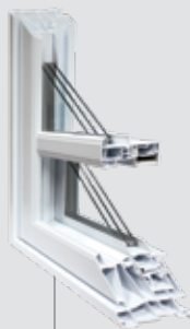
Guillotine 4 1/2" PVC Ouverture double