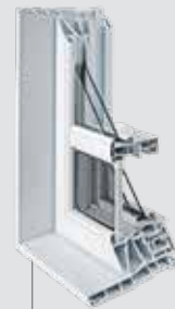
Guillotine 6 9/16" PVC Ouverture simple