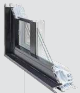
Couissant 5 3/4" HYBRIDE Volet plat