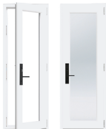
Vue intérieure Fermée