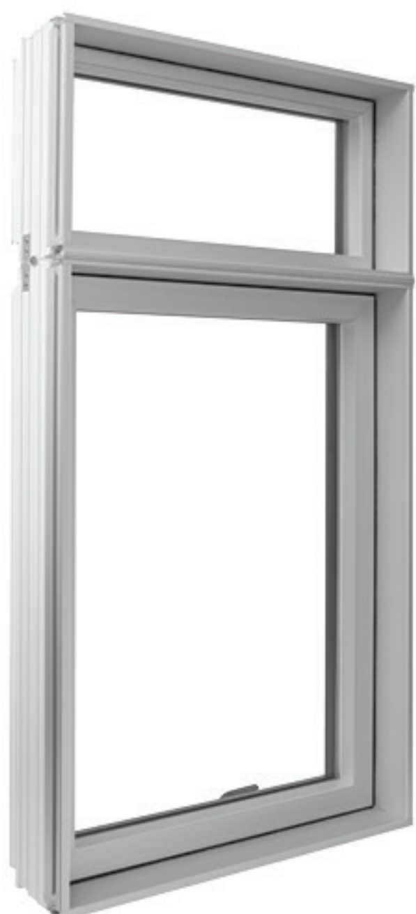
Vue extérieure - Anodisé