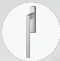
Poignée levante 2 côtés

Maximisez l'effet panoramique de votre porte-patio avec de grandes dimensions en 2 sections grâce à une capacité de charge très élevée.