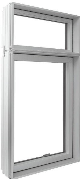
Vue extérieure - Anodisé