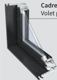
Cadre 6 9/16" Volet plat